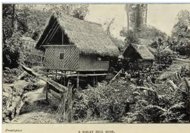
Lombongan lampan (Kinta Tin Mining Museum, 10 April 2021:

"Mining method: Lampan (Ground Sluicing)").