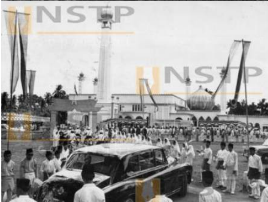
Kiri: Masjid baru setelah disiapkan (-, 20 July 1970: