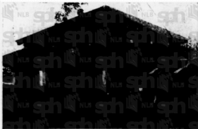
Masjid lama berumur 50 tahun