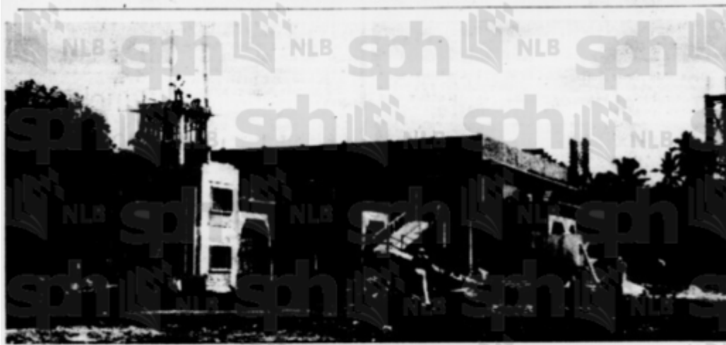
Masjid baru sedang di-bena