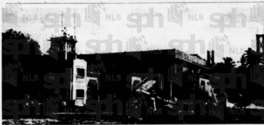
Masjid baru sedang di-bena