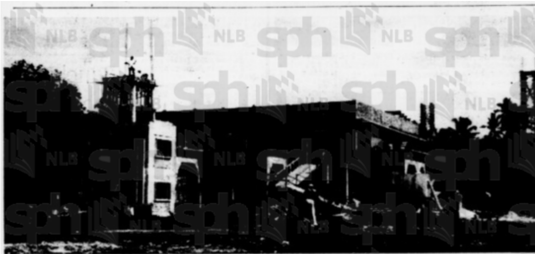
Masjid baru sedang di-bena