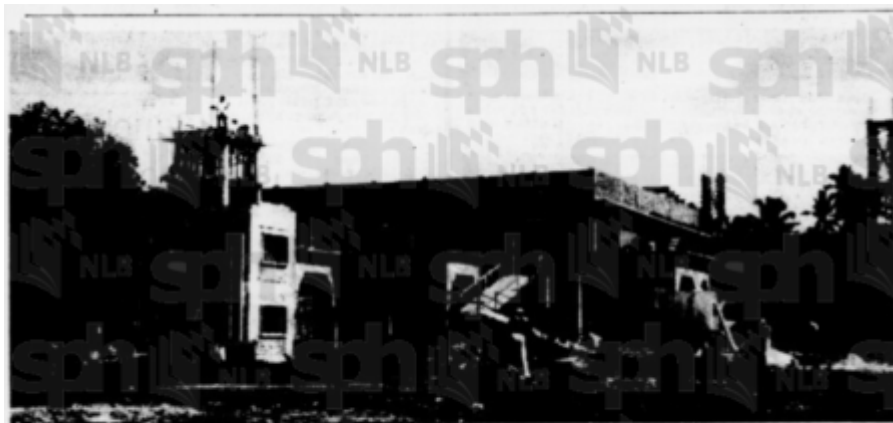
Masjid baru sedang di-bena