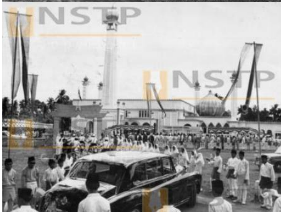
Kiri: Masjid baru setelah disiapkan (-, 20 July 1970: