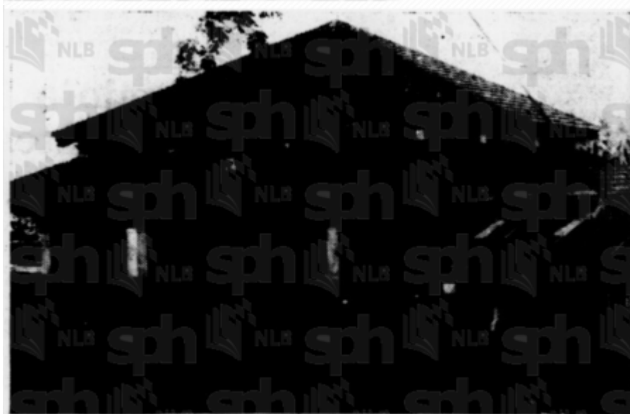
Masjid lama berumur 50 tahun

Kiri: "Masjid baru sedang di-bena" (Berita Harian, 27 December 1969, Page 4: