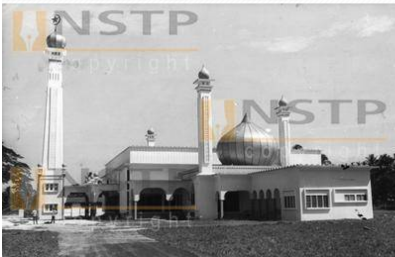
Kiri: "Masjid baru sedang di-bena" (Berita Harian, 27 December 1969, Page 4: