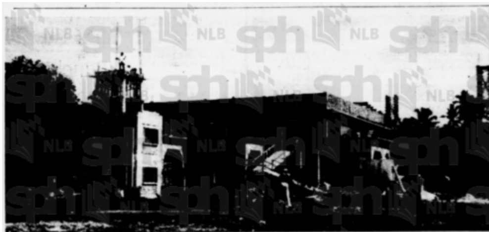
Masjid baru sedang di-bena