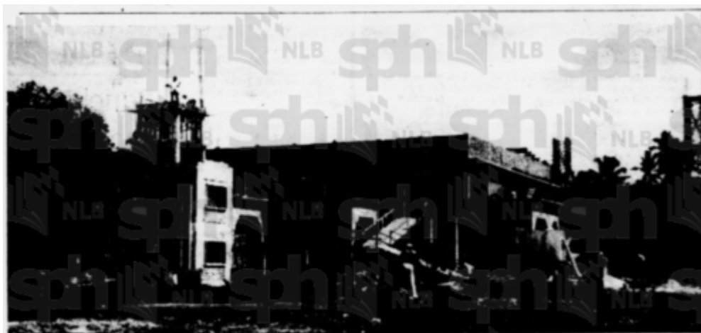
Masjid baru sedang di-bena