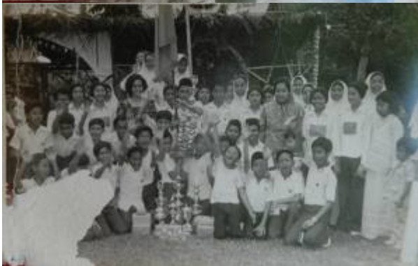
Kiri: "yes...menang lagi". Tengah: "olahragawan & olahragawati". Kanan: "the celebration".