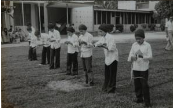
Kiri: "beratur-beratur....". Tengah: "dengar ucapan sebelum sukan". Kanan: "acara menganyam ketupat pun ada".