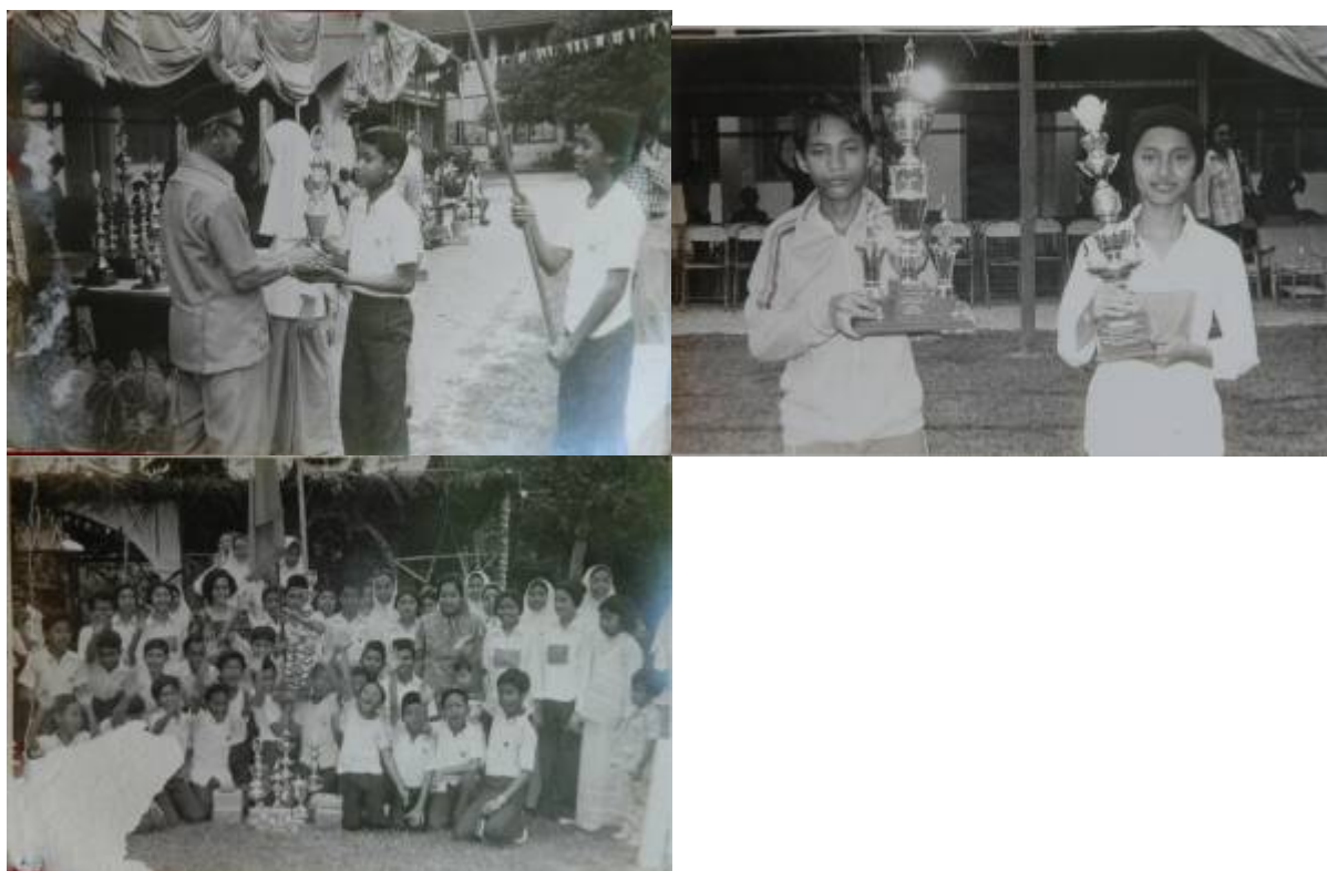
Kiri: "yes...menang lagi". Tengah: "olahragawan & olahragawati". Kanan: "the celebration".