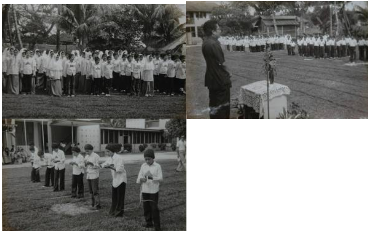
Kiri: "beratur-beratur...". Tengah: "dengar ucapan sebelum sukan". Kanan: "acara menganyam ketupat pun ada".