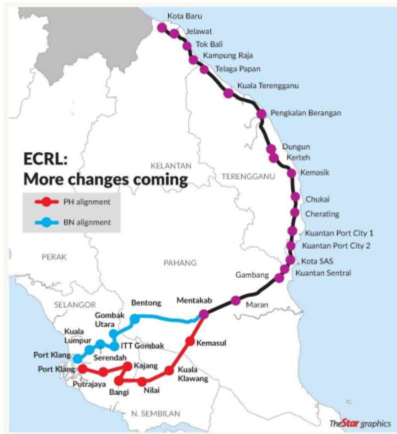
“Figure 4: The Original and Renegotiated Alignments (Source: The Star)”

“..... A weak spot in governance aspects of ECRL is resettlement. For instance, a contentious issue that arose from the PH government’s new southern alignment was the impact of the project to the settlements of orang asli (indigenous people) in Negeri Sembilan. There are 14 orang asli settlements along the alignment, two are directly affected by the alignment, namely Kampung Orang Asli Bukit Jenuk in Sepang, Selangor and Kampung Orang Asli Lumut in Seremban, Negeri Sembilan.xxv The new alignment has also led to opposition from orang asli community in Kuala Langat Forest Reserve in Selangor.xxvi”