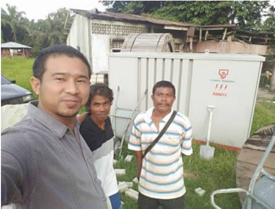
(Sumber: Azlan Sharif @ Facebook, 2 Ogos 2016: "Tnb dah masuk kampung orang asli daerah sepang ini...").