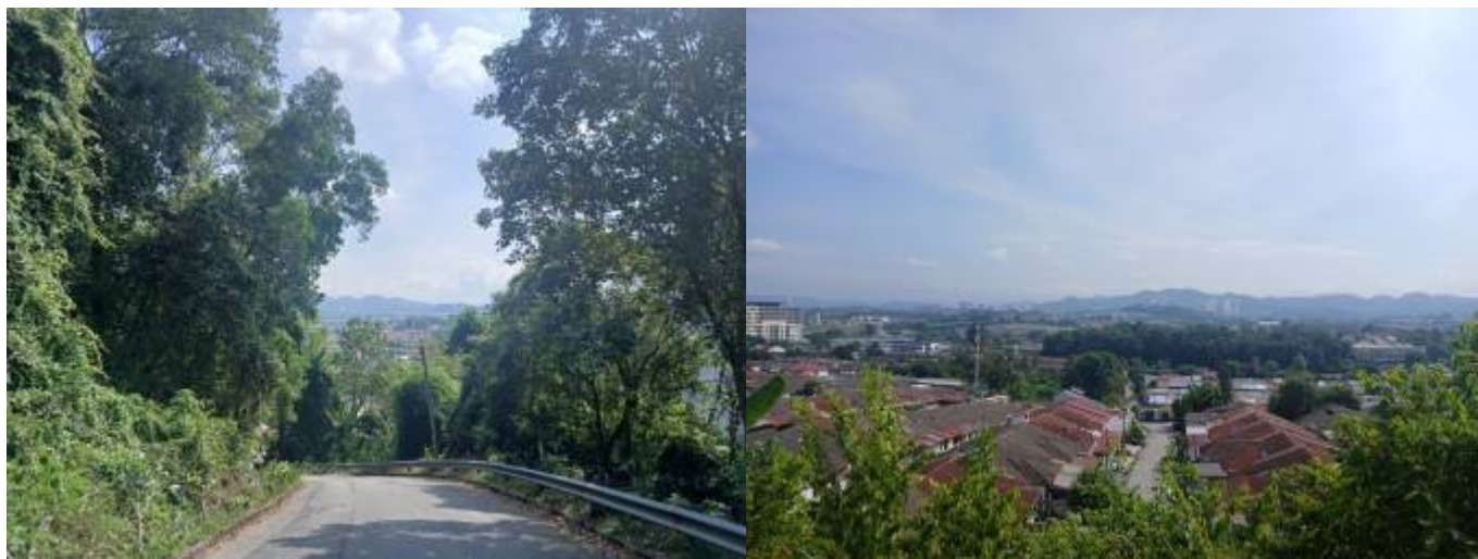
Pemandangan dari lereng Bukit Jeloh, menghadap pinggir sebelah timur pekan Kajang di sebelah utara, dilatari banjaran bukit (kemungkinan Bukit Sungai Long), 2025.