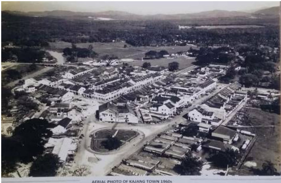
AERIAL PHOTO OF KAJANG TOWN 1960s