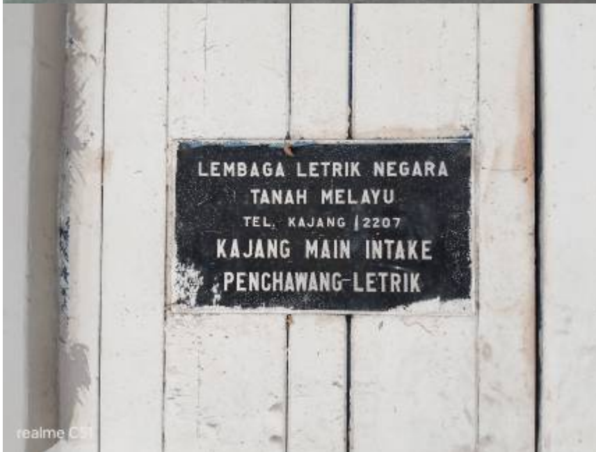
Kiri: Facebook Bandar Kajang, 28 Oktober 2019: