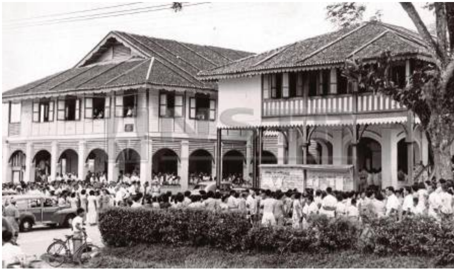
"The Kajang courts building was as popular as the town's parks! NSTP PIC (1956)" (David Christy @ New Straits Times, 24 Februari 2019: