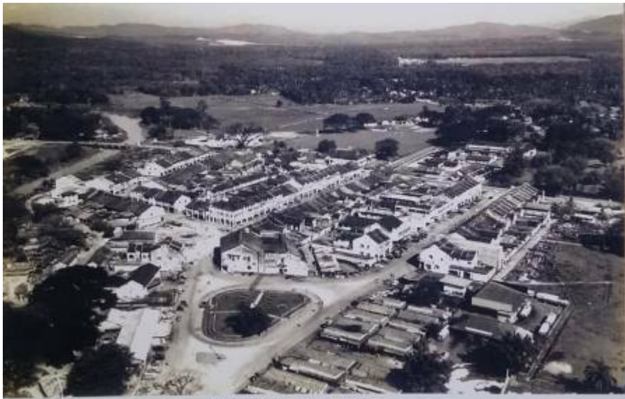
AERIAL PHOTO OF KAJANG TOWN 1960s