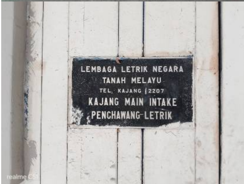
Kiri: Facebook Bandar Kajang, 28 Oktober 2019: